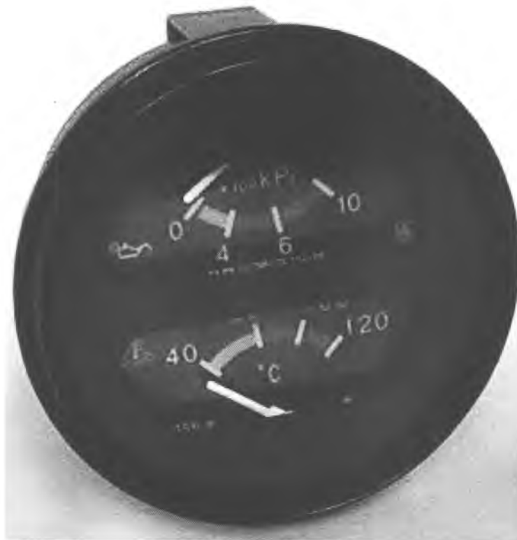
Рисунок А.2 - Фотография