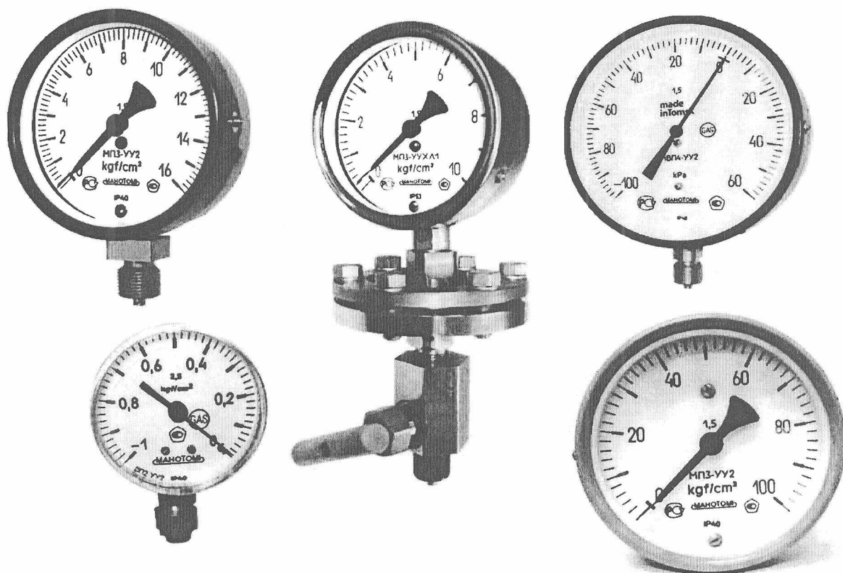
Рисунок 1 — Фотографии общего вида приборов

Фотографии общего вида приборов приведены на рисунке 1