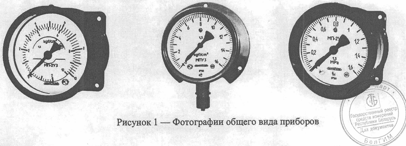
Рисунок 1 — Фотографии общего вида приборов

Фотографии общего вида приборов приведены на рисунке 1.