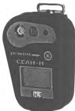
Рис.1. Фотография общего вида газоанализатора СЕАН-Н

Газоанализаторы представляют собой автоматические, индивидуальные одноканальные приборы непрерывного действия, выполненные в едином корпусе. Корпус газоанализатора выполнен из прочной пластмассы (полиметилметакрилата) и состоит из передней и задней крышек. На передней панели расположен жидкокристаллический дисплей и кнопка РЕЖИМ для управления прибором. В газоанализаторах используется диффузионный отбор проб через отверстие на передней панели.