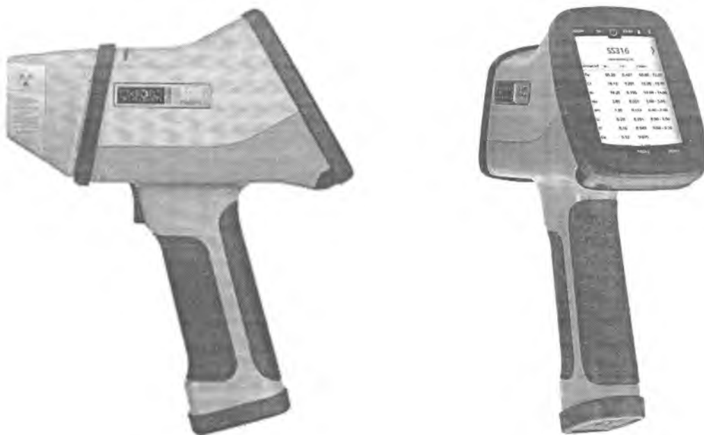
Рисунок 1 – внешний вид спектрометра

Внешний вид спектрометров приведен на рисунке 1.