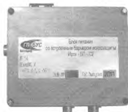
г) Блок питания «Ирга-БП» без индикатора