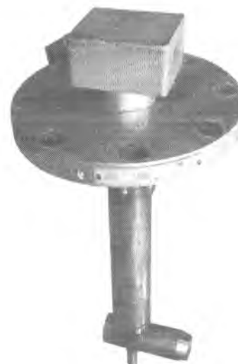
б) Расходомер «Ирга-РВ» (погружное исполнение)