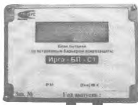
в) Блок питания «Ирга-БП» с индикатором