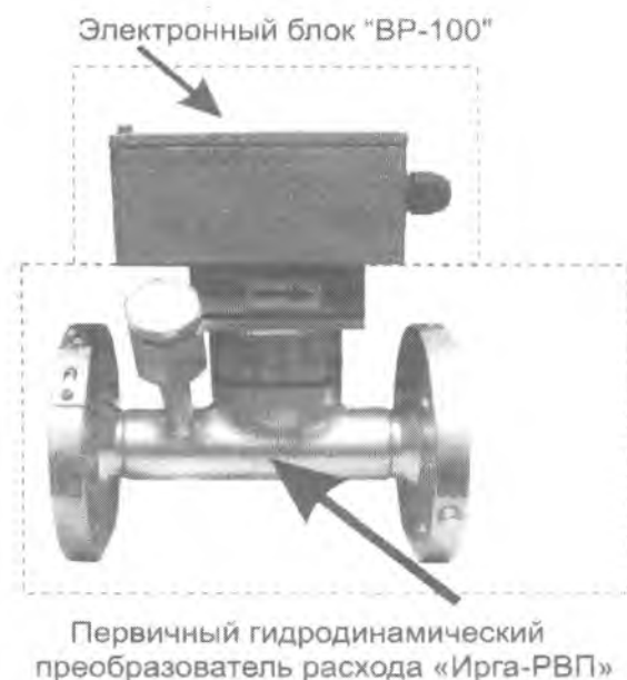
а) Расходомер «Ирга-РВ» (проходное исполнение)