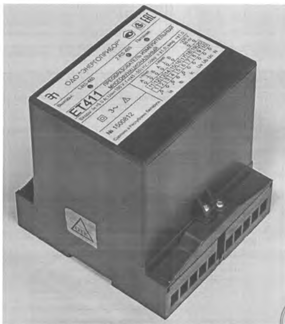
Рисунок 2. Фотография общего вида