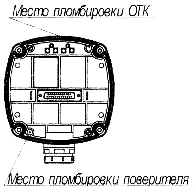
Рисунок 2 - Схема пломбировки сигнализаторов от несанкционированного доступа