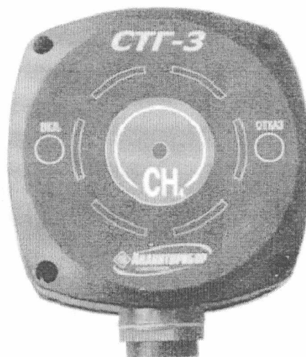
Рисунок 1 - Внешний вид сигнализатора

Схема пломбировки от несанкционированного доступа приведена на рисунке 2.