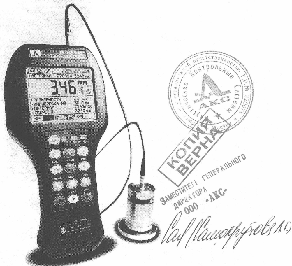
Рисунок 1 – Толщиномер электромагнитно-акустический А1270

Фотография толщиномера с подключенным ЭМА-преобразователем представлена на рисунке 1.