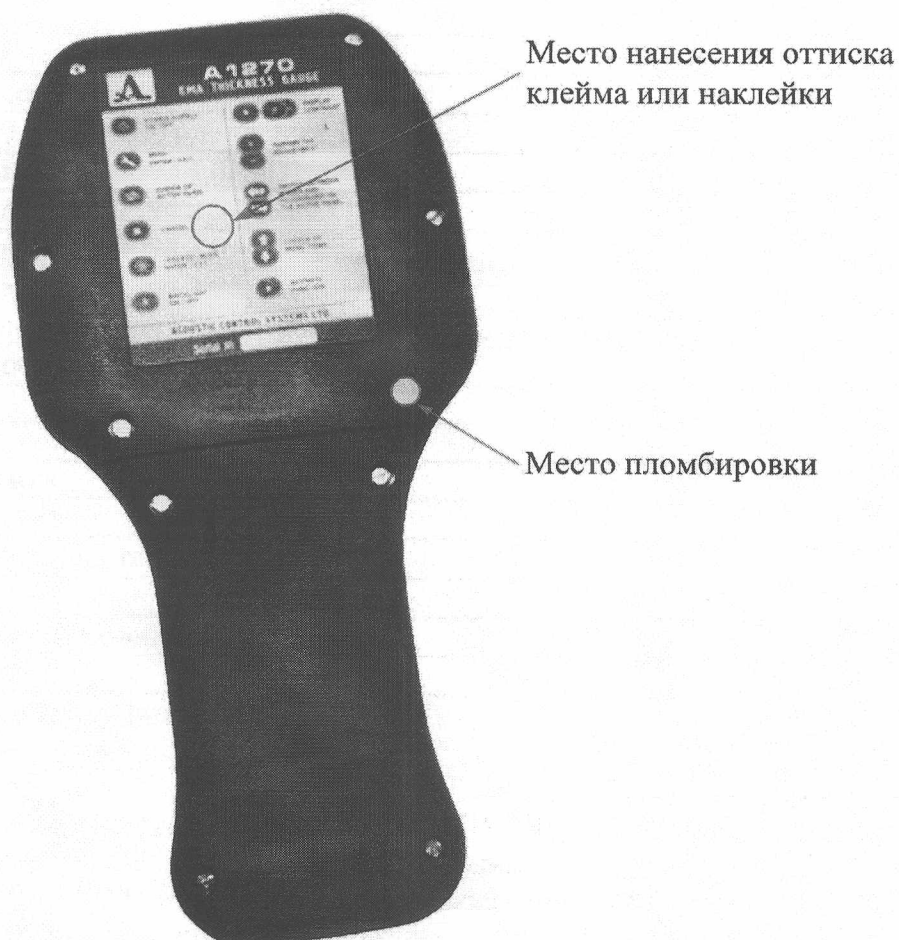
Рисунок 2 – Место пломбировки корпуса толщиномера и место нанесения оттиска клейма или наклейки

На рисунке 2 показаны место пломбировки корпуса толщиномера для предотвращения несанкционированного доступа и место нанесения оттиска клейма или наклейки.