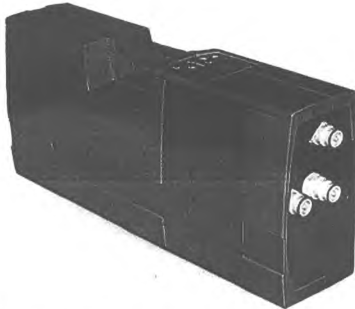
Рис.1 – Внешний вид анализаторов ртути РА-915М