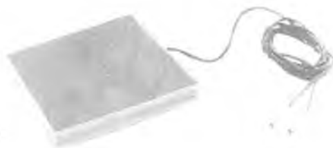
Камера ионизационная ДРК-1Э-К01