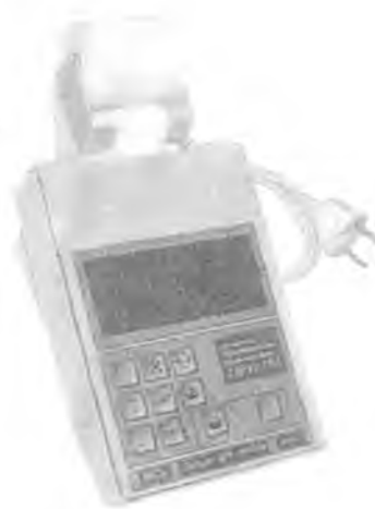
Пульт управления ДРК-1М-П02