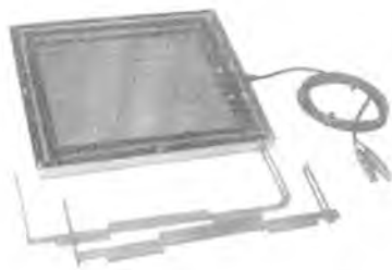
Камера ионизационная ДРК-1М-К01