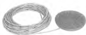
Камера ионизационная ДРК-1М-К12