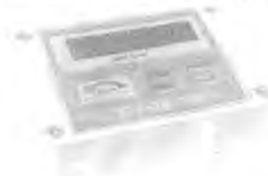
Пульт измерительный ДРК-1М-Э04