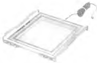
Камера ионизационная ДРК-1-К01

Внешний вид дозиметров ДРК и схемы пломбировки приведены на рисунках 1, 2, 3 и 4.