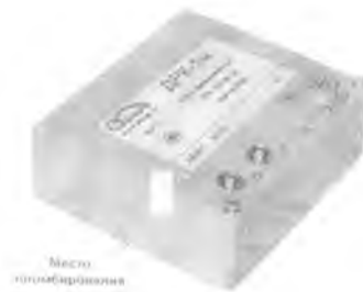
Пульт измерительный ДРК-1М-Э01-А