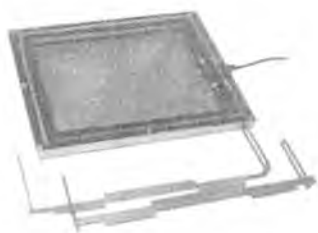
Камера ионизационная ДРК-1М-К05