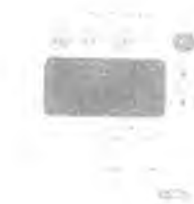
Пульт управления ДРК-1М-1103-М