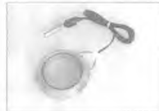
Камера ионизационная ДРК-1-К02