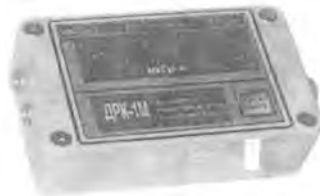
Пульт измерительный ДРК-1М-Э03