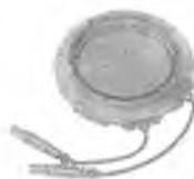
Камера ионизационная ДРК-1М-К02-А