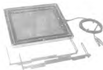
Камера ионизационная ДРК-1М-К19