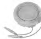
Камера ионизационная ДРК-1М-К02