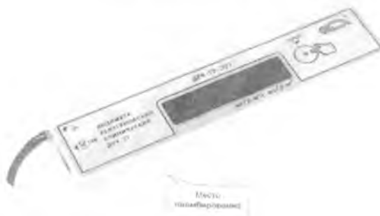
Пульт измерительный ДРК-1Э-Э01