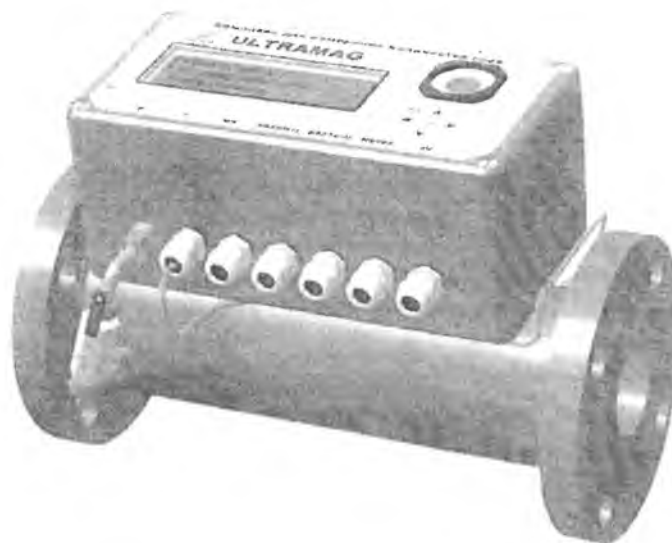
Рисунок 1 – Общий вид комплексов «ULTRAMAG»

Комплексы имеют 3 варианта исполнения по погрешности измерения рабочего расхода и следующие модификации в зависимости от верхней границы диапазона измерения рабочего расхода: G16, G25, G40, G65, G100, G160, G250.