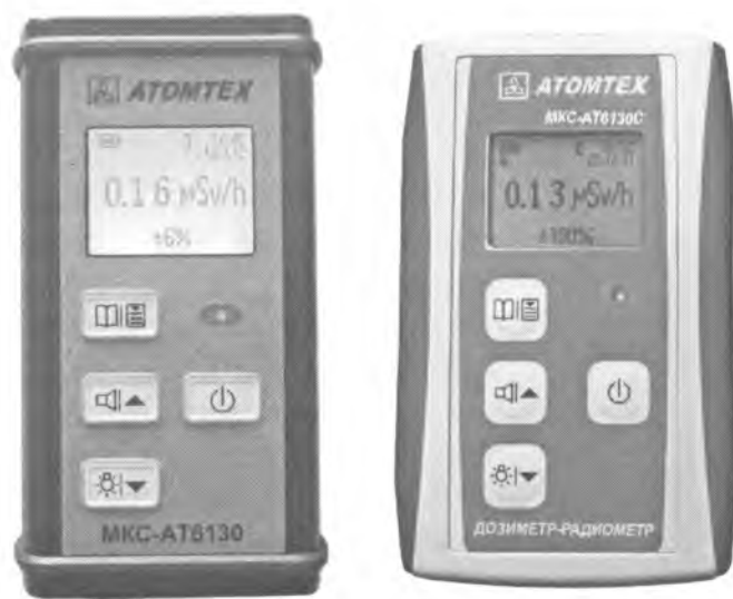
Рисунок 1 – Общий вид приборов