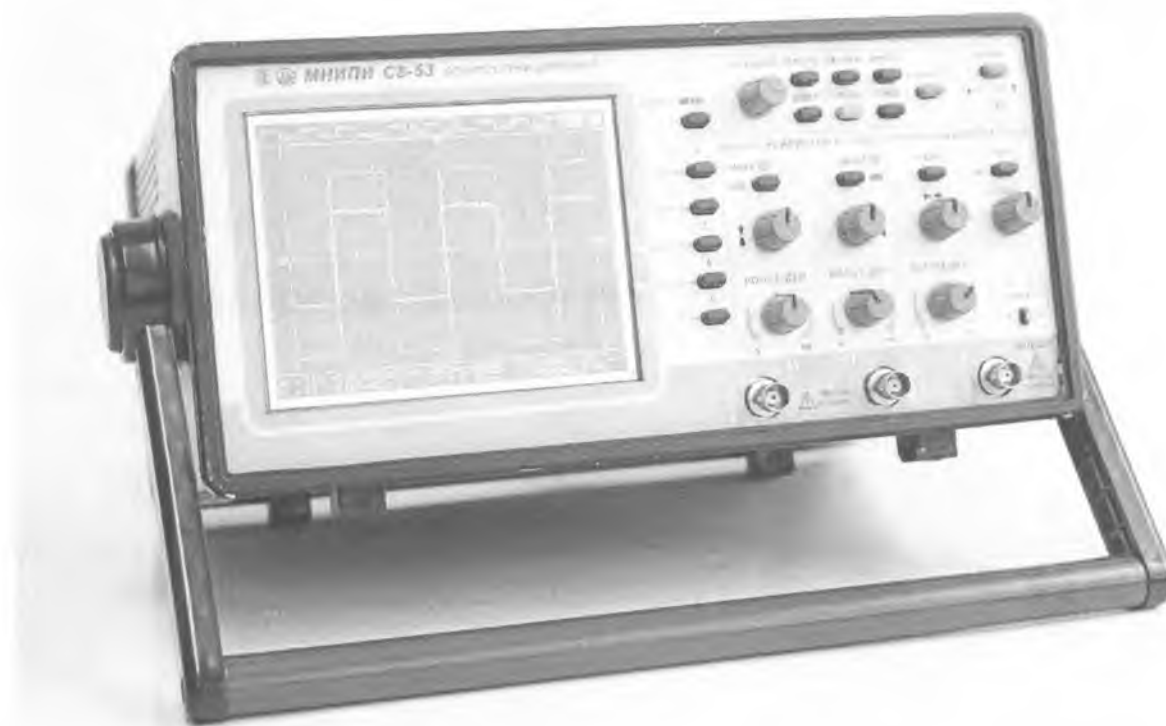
Рисунок 1 – Осциллограф С8-53

Места нанесения оттиска знака поверки и оттиска клейма ОТК показаны в приложении А, рисунок А2.