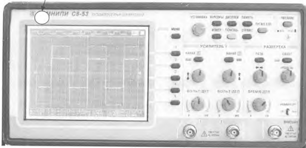
Рисунок А.1 – Передняя панель осциллографа с указанием места нанесения знака поверки (клейма-наклейки)

Место нанесения знака поверки (клейма-наклейки)