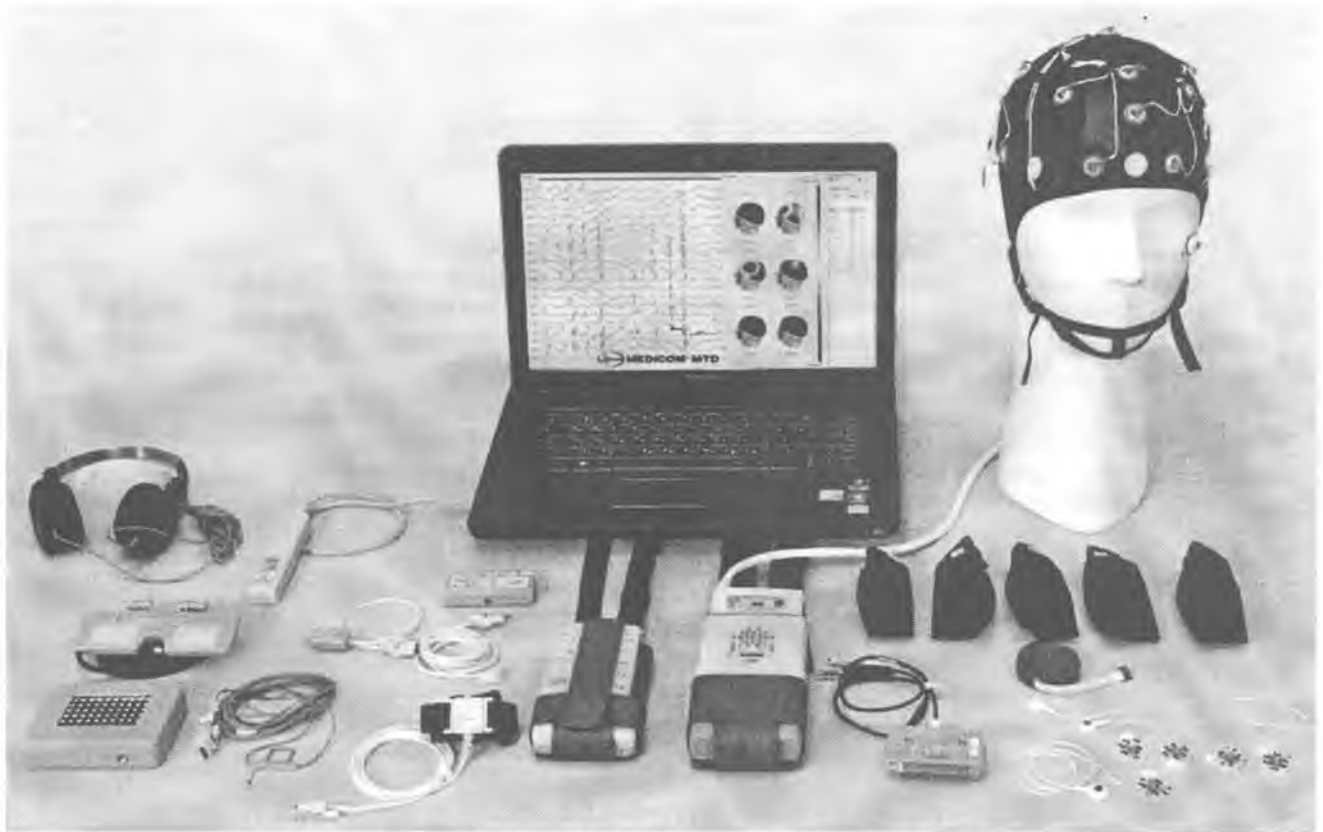
Рисунок 1 – Фотография общего вида регистраторов

Регистраторы выпускаются в 2-х модификациях и 10 типовых комплектах, ориентированных на применение, определенное характеристиками из таблицы 1.