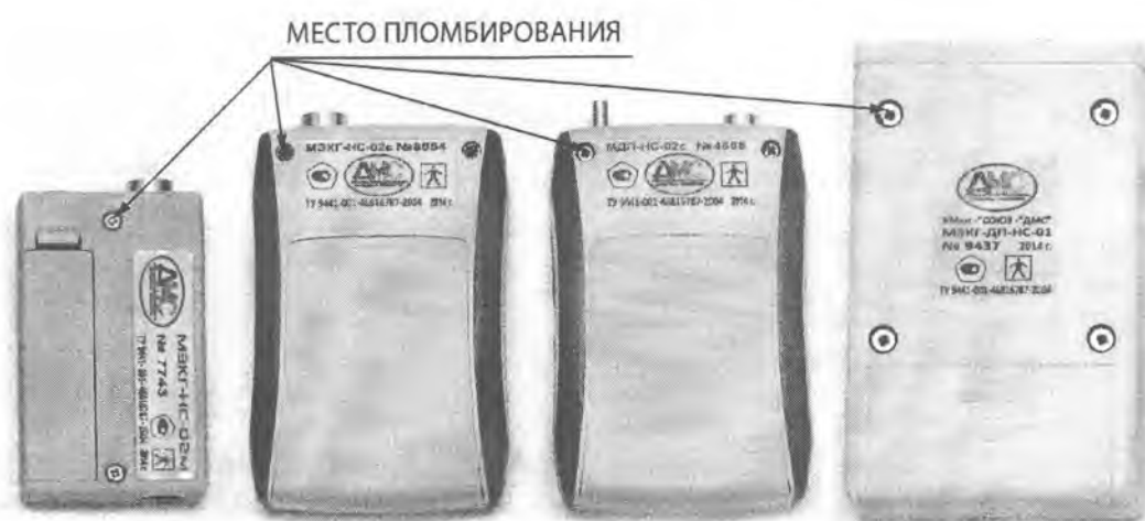
Рисунок 3 - место пломбирования мониторов Комплекта КМкн-«Союз-«ДМС».