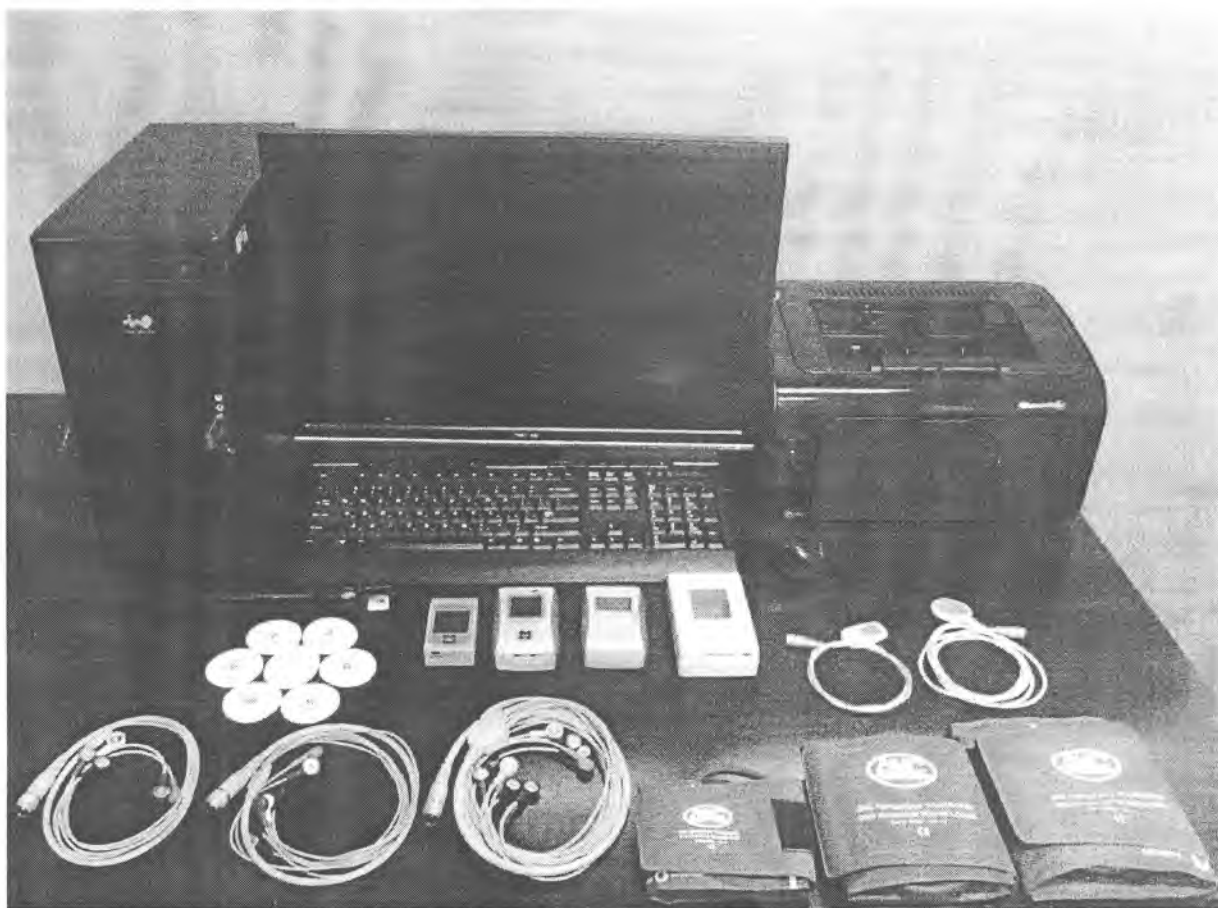
Рисунок 1 - общий вид Комплекта КМкн-«Союз-«ДМС» с принадлежностями и расходными материалами

Общий вид Комплекта мониторов компьютеризированных носимых одно, двух, трехсуточного мониторинга ЭКГ, АД, ЧП КМкн-«Союз-«ДМС» с основными принадлежностями, место нанесения на мониторы знака утверждения типа и место пломбирования мониторов показано на рисунках 1, 2, 3 соответственно.