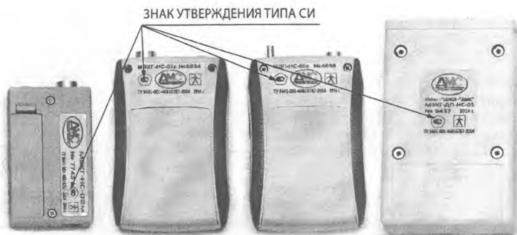
Рисунок 2 - место нанесения знака утверждения типа на мониторы комплекта КМкн-«Союз-«ДМС»