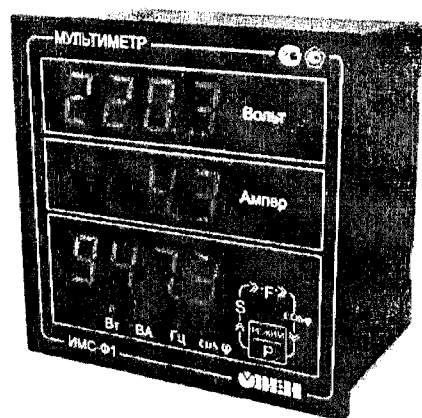
Общий вид приборов в корпусе Щ1 Рисунок 1

Фотографии общего вида приборов приведены на рисунках 1 и 2.