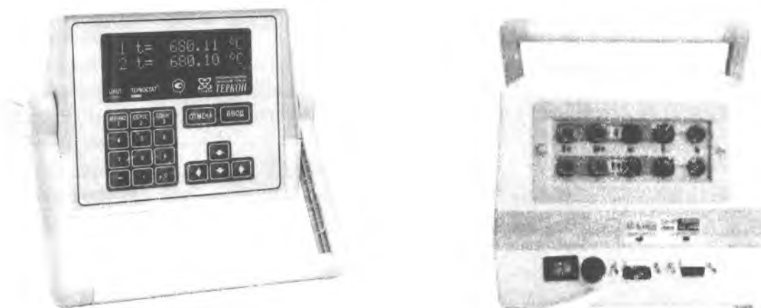
а) вид спереди

Прибор «Теркон» является переносным настольным прибором с ручкой, используемой для переноски и фиксации в нужном положении на столе (рисунок 1).