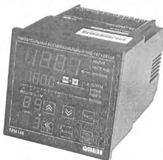
Рис.1 - Общий вид приборов в исполнении Щ4

Фотографии общего вида приборов приведены на рисунках 1 и 2.