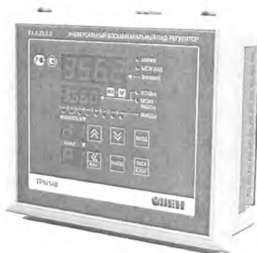
Рис.2 - Общий вид приборов в исполнении Щ7