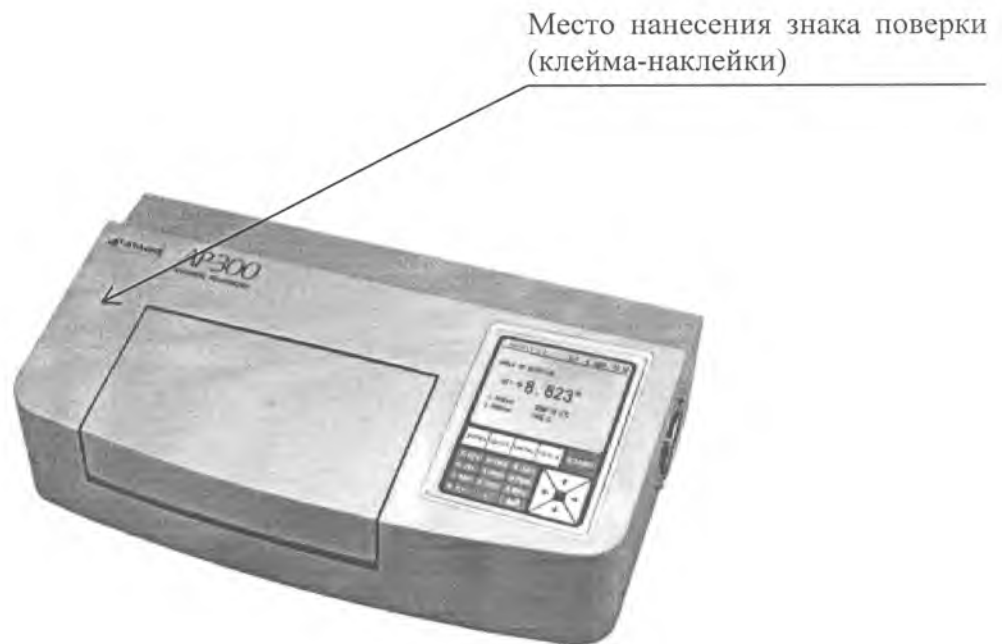
Рисунок 3 - Место нанесения знака поверки на поляриметр автоматический AP-300

Схема нанесения знака поверки в виде клейма-наклейки