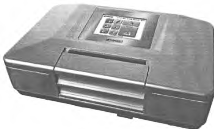
Рисунок 2 – Внешний вид поляриметров автоматических SAC-i