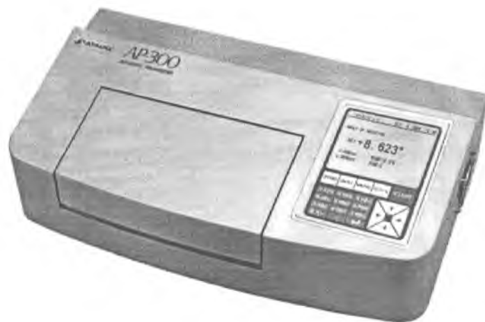
Рисунок 1 – Внешний вид поляриметров автоматических AP-300

Место нанесения знака поверки в виде клейма-наклейки указано в приложении А.