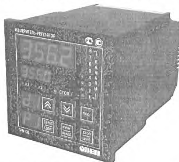
Рис.1 - Общий вид приборов в исполнении Щ4

Фотографии общего вида приборов приведены на рисунках 1 и 2.