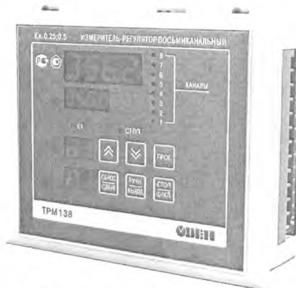
Рис.2 - Общий вид приборов в исполнении Щ7