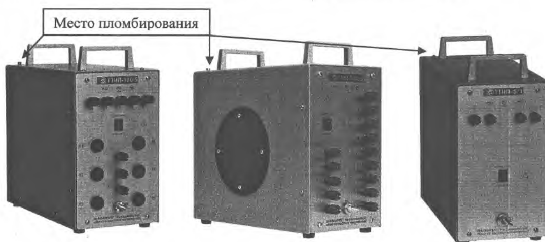
Рисунок 1 - Общий вид исполнений ТТИП и место пломбирования.

Внешний вид ТТИП и место пломбирования после поверки представлены на рисунке 1 (мастичная пломба наносится на в гнездо винта крепления крышки).