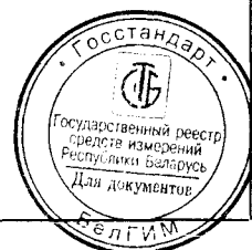
Схема пломбировки от несанкционированного доступа и указание мест для нанесения оттисков клейм отдела технического контроля (далее – ОТК) и оттисков клейм знака поверки средств измерений (далее – Знак поверки) на лицевой панели УПП приведена на рисунке А.1 (приложение А).

Фотография общего вида УПП приведена на рисунке 1.