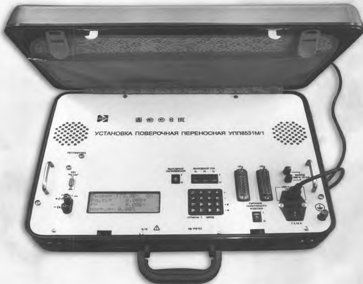
Рисунок 1 – Фотография общего вида УПП