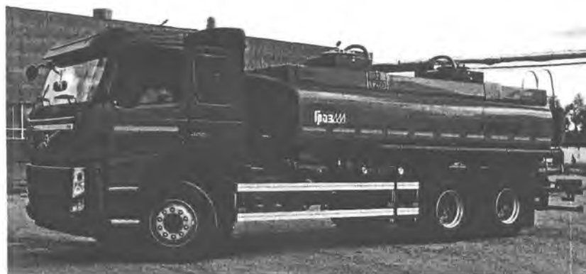
Фото 1. Общий вид автоцистерны ГРАЗ-АЦ-15,0

В зависимости от материала (сталь или алюминиевый сплав) цистерны имеют варианты исполнения М1 и М2.