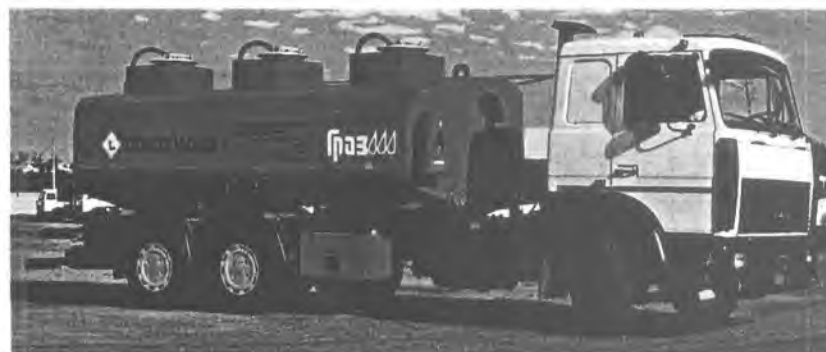
Фото 2. Общий вид автотопливозаправщика ГРАЗ-АТЗ-17,0.