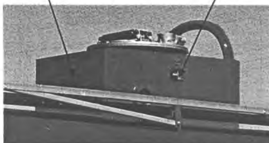
Рисунок 1. Обозначение места для нанесения оттиска поверительного клейма.