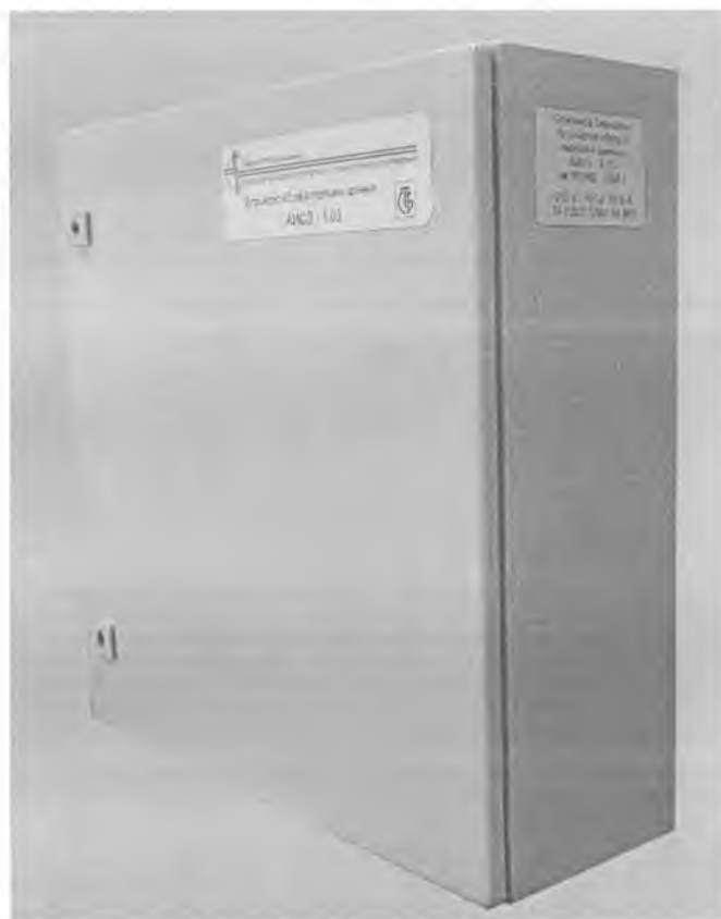
Рисунок 2 - Общий вид устройства

Схема пломбирования устройства для ограничения несанкционированного доступа к регулировочным элементам с обозначением мест для нанесения государственного поверительного клейма-наклейки и оттиска государственного поверительного клейма приведена в Приложении А.