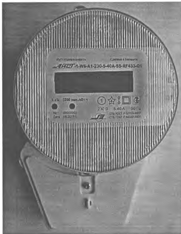
Рисунок 5 – Внешний вид счетчика в корпусе модификации W6