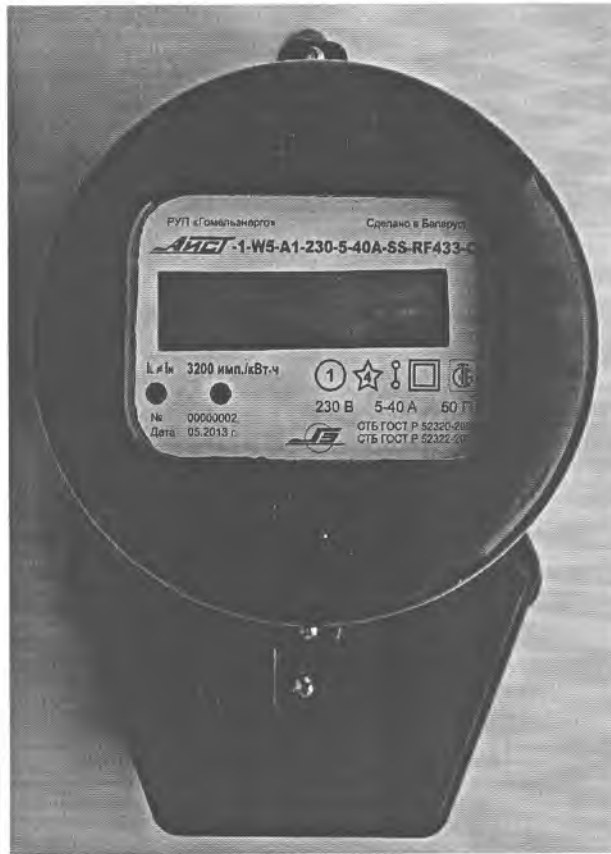
Рисунок 4 – Внешний вид счетчика в корпусе модификации W5