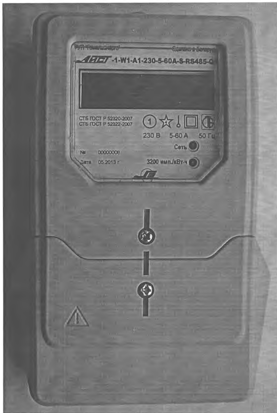
Рисунок 2 – Внешний вид счетчиков в корпусе модификации W1

Внешний вид счетчика представлен на рисунках 2-5. Схемы пломбирования счетчиков от несанкционированного доступа к элементам счетчика с указанием мест нанесения знаков поверки приведены в приложении А.