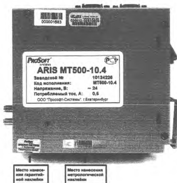
Рисунок 1 - Общий вид и места пломбирования контроллера ARIS MT500

Контроллеры ARIS MT500 осуществляют самодиагностику и фиксируют все случаи неисправности в журнале событий в энергонезависимой памяти, обеспечивают автоматический контроль достоверности передаваемой информации по каналу связи со счетчиком и автоматическую проверку работоспособности счетчиков с самотестированием и записью в журнал событий контроллера. Все электронные компоненты ARIS MT500 размещены в пломбируемых корпусах (рис. 1).