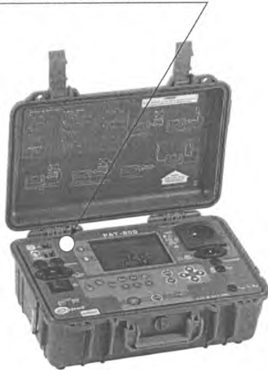
Рисунок А.1 – Место нанесения поверительного клейма-наклейки

Место нанесения поверительного клейма-наклейки