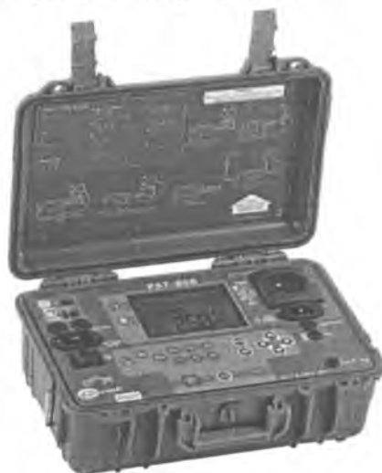
а) – РАТ-800

Внешний вид измерителей приведен на рисунке 1.