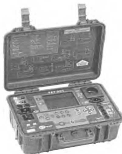
б) – РАТ-805