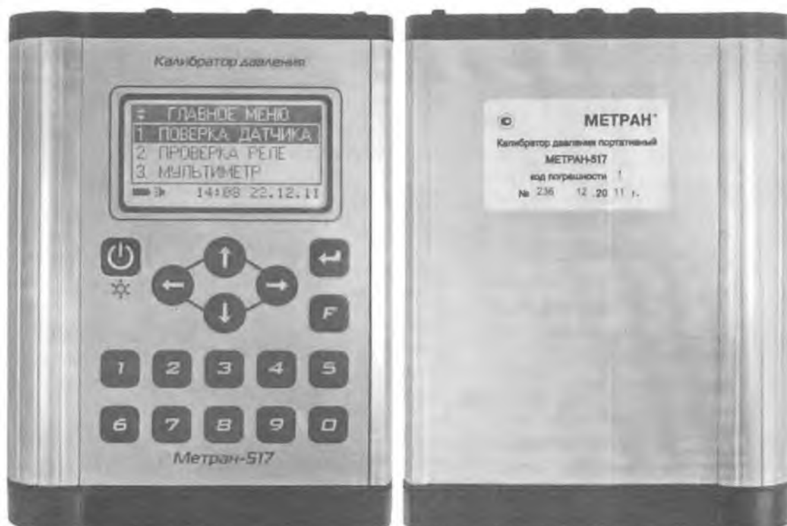
Рисунок 1 - Внешний вид калибратора Метран-517

Внешний вид калибратора представлен на рисунке 1.