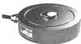
Рисунок 1 – Внешний вид датчика М30

Внешний вид датчиков показан на рисунках 1 – 4.