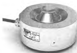
Рисунок 3 – Внешний вид датчиков М70