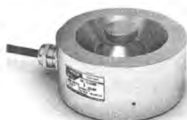
Рисунок 2 – Внешний вид датчика М50