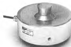
Рисунок 4 – Внешний вид датчика М100

Маркировка датчиков производится на фирменной наклейке, на которой нанесены: