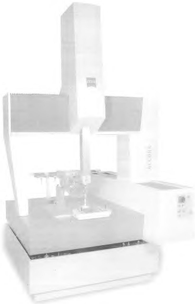
Рисунок 1 Координатно-измерительная машина Ассуга.

Внешний вид машин координатно-измерительных приведен на рисунке 1.