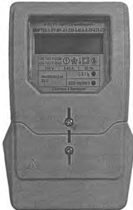
Рисунок 2 – Внешний вид счетчика в корпусе модификации W1

Внешний вид счетчика представлен на рисунках 2-4. Схемы пломбирования счетчиков от несанкционированного доступа к элементам счетчика с указанием мест нанесения знаков поверки приведены в приложении А.