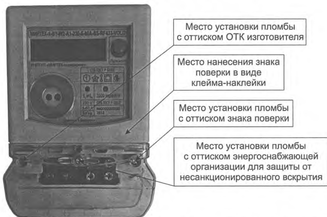
Рисунок А.2 – Места установки пломб и нанесения знака поверки для счетчиков в корпусе модификации W2