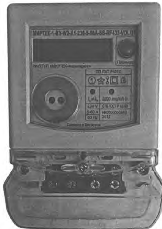
Рисунок 3 – Внешний вид счетчика в корпусе модификации W2