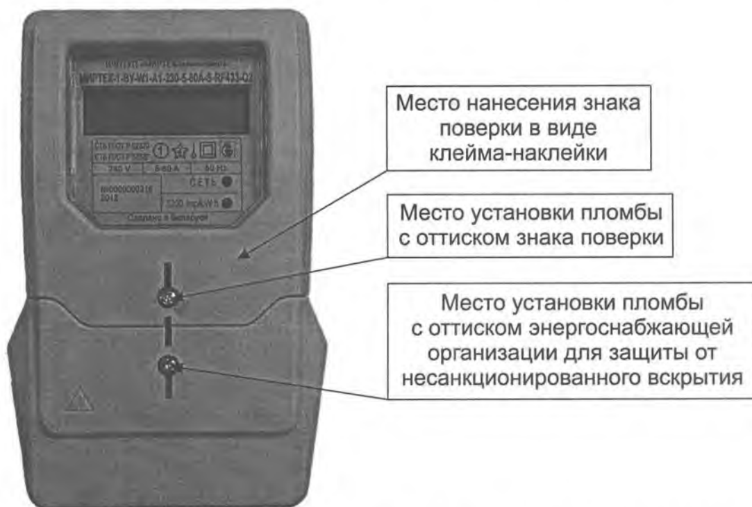
Рисунок А.1 – Места установки пломб и нанесения знака поверки для счетчиков в корпусе модификации W1

Места установки пломб и нанесения знака поверки