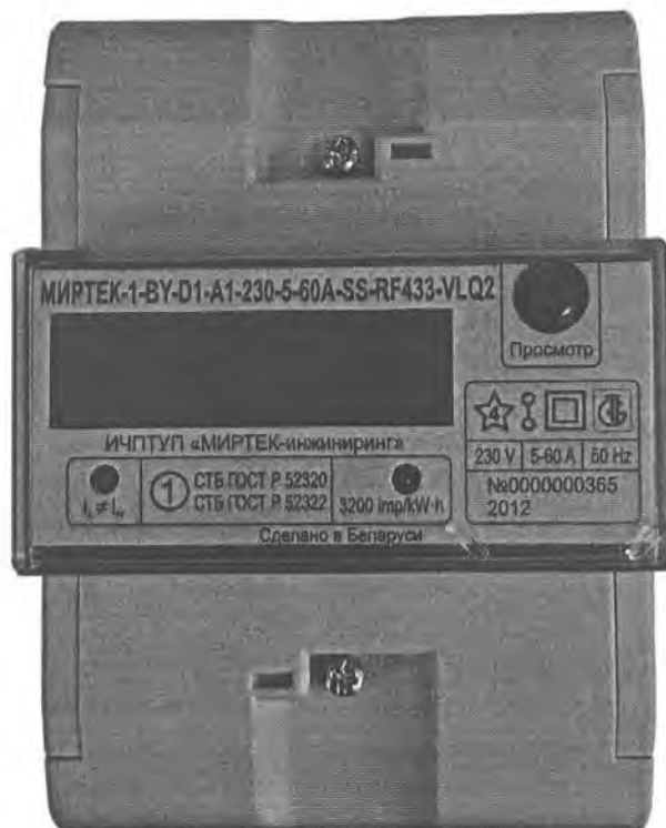
Рисунок 4 – Внешний вид счетчика в корпусе модификации D1

Счетчик ведет учет электрической энергии по действующим тарифам (до 4) в соответствии с месячными программами смены тарифных зон (количество месячных программ – до 12, количество тарифных зон в сутках – до 48). Месячная программа может содержать суточные графики тарификации рабочих, субботних, воскресных и специальных дней. Количество специальных дней (праздничные и перенесенные дни) – до 45. Для специальных дней могут быть заданы признаки рабочей, субботней, воскресной или специальной тарифной программы. Счетчик содержит в энергонезависимой памяти две тарифных программы – действующую и резервную. Резервная тарифная программа вводится в действие с определенной даты, которая передается отдельной командой по интерфейсу.