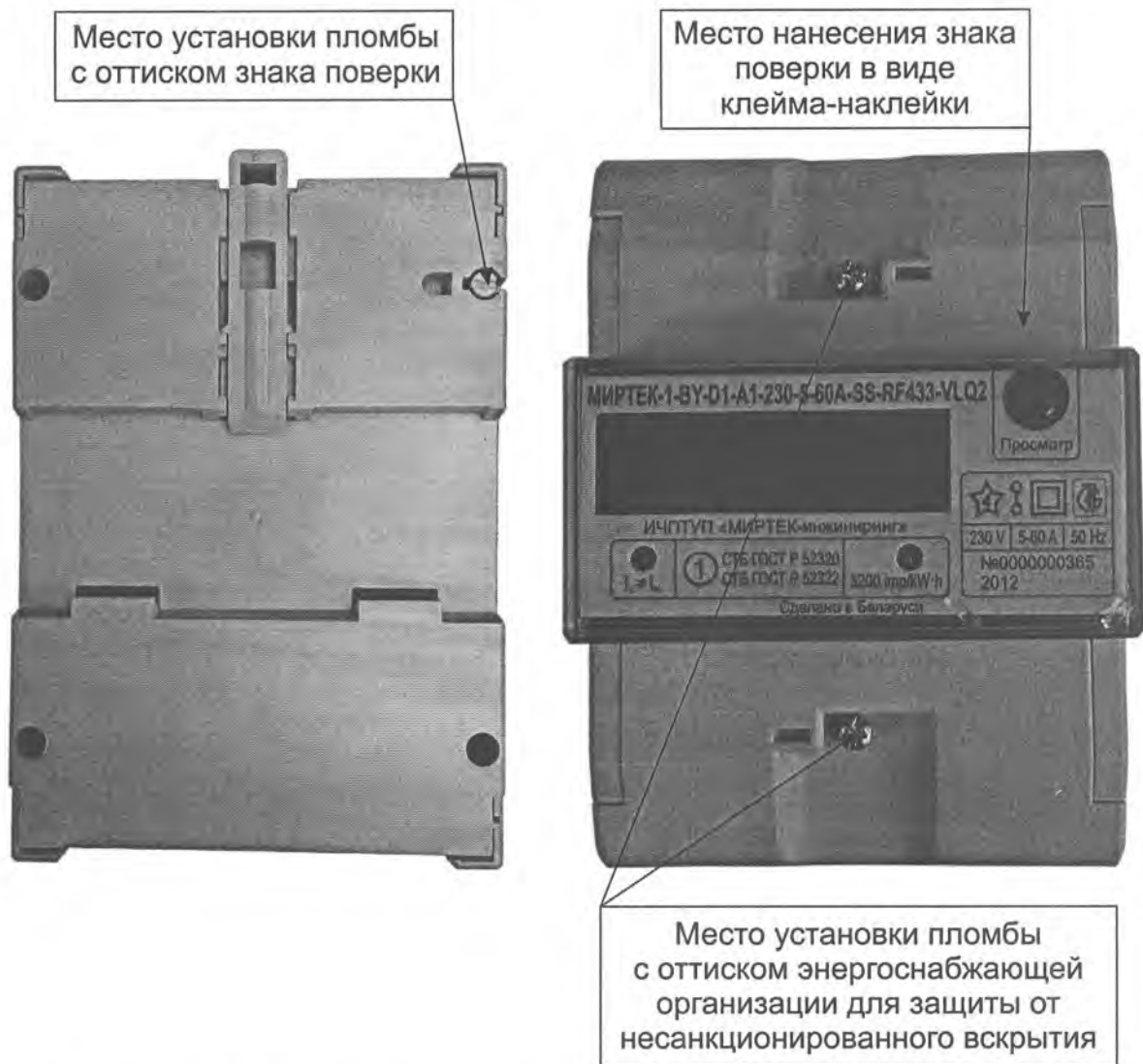
Рисунок А.3 – Места установки пломб и нанесения знака поверки для счетчиков в корпусе модификации D1