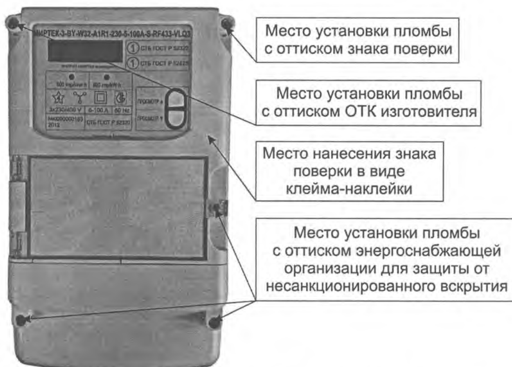
Рисунок А.2 – Места установки пломб и нанесения знака поверки для счетчиков в корпусе модификации W32