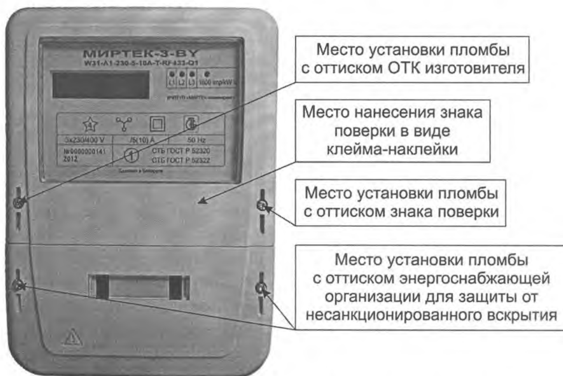
Рисунок А.1 – Места установки пломб и нанесения знака поверки для счетчиков в корпусе модификации W31

Места установки пломб и нанесения знака поверки