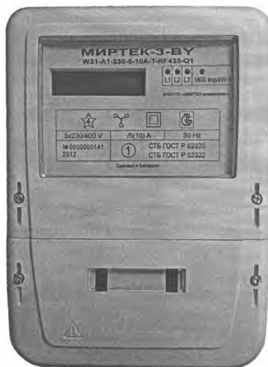
Рисунок 2 – Внешний вид счетчика в корпусе модификации W31

Внешний вид счетчиков представлен на рисунках 2, 3. Схемы пломбирования счетчиков от несанкционированного доступа к элементам счетчика с указанием мест нанесения знаков поверки приведены в приложении А.