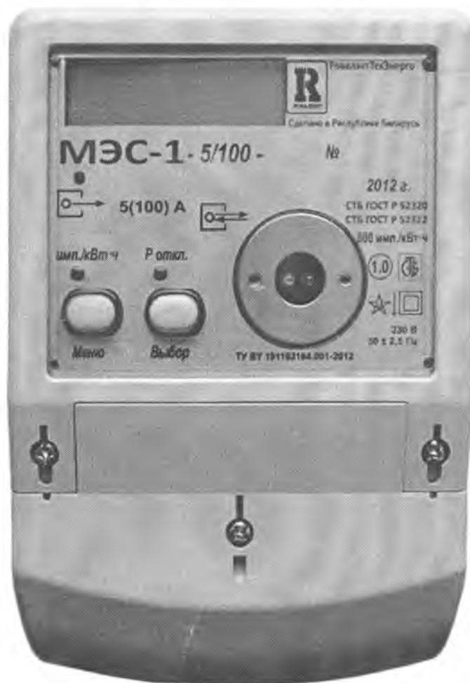
Рисунок 2 – Внешний вид счетчиков МЭС-1