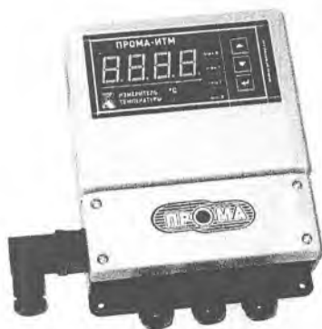
Фото 2. Фотография общего вида измерителя настенного исполнения ПРОМА-ИТМ-Н.