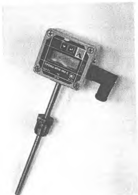
Фото 4. Фотография общего вида измерителя ПРОМА-ИТМ-МИ-С.