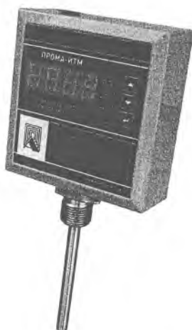
Фото 3. Фотография общего вида измерителя для установки на трубопровод ПРОМА-ИТМ-Р.