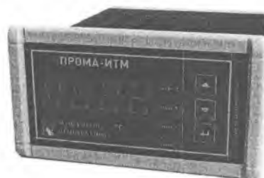
Фото 1. Фотография общего вида измерителя щитового исполнения ПРОМА-ИТМ-Щ.

Фотографии общего вида измерителей приведены на фото 1,2,3,4.