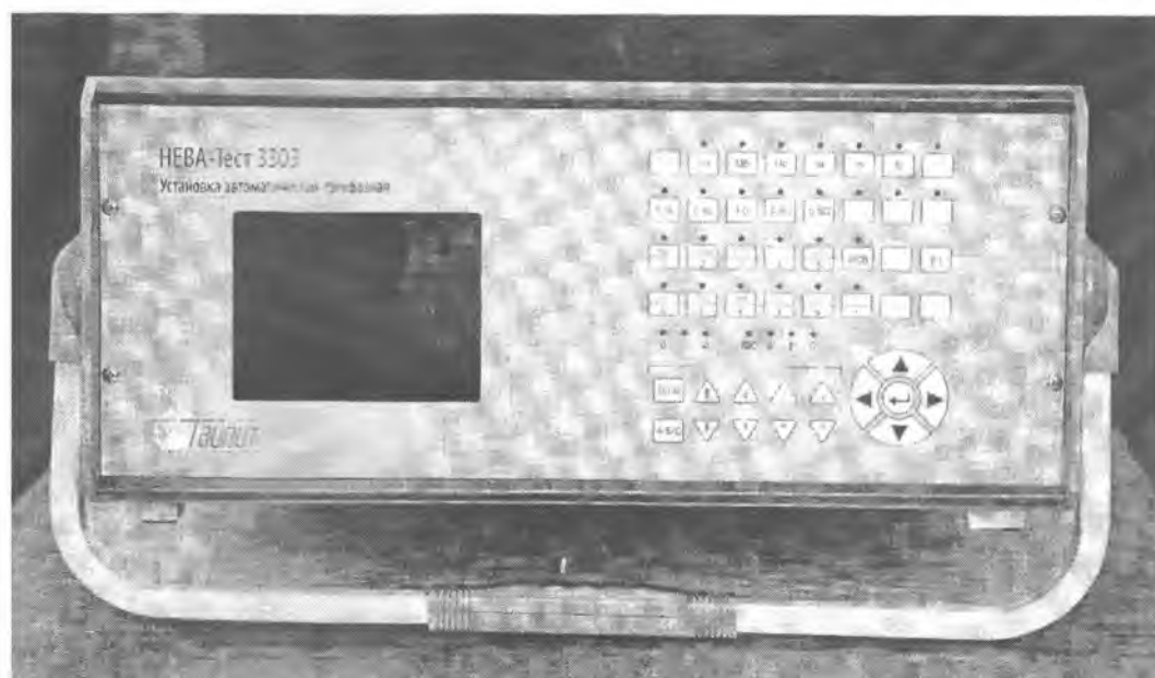
Рис. 2 Установка HEVA-Тест 3303П