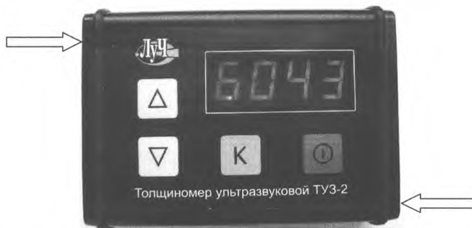
Рисунок 1 - Общий вид толщиномеров ТУЗ-2 и места нанесения пломбировки.

Фотография толщиномера представлена на рисунке 1.