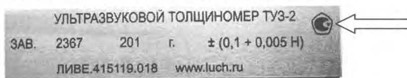
Рисунок 2 – Место нанесения знака утверждения типа.

На торцевых панелях расположены разъемы для подключения УЗ ПЭП, встроенный тест-образец и разъем для подключения зарядного устройства.