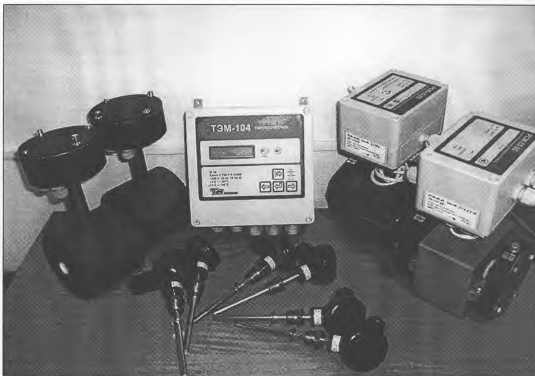
Рисунок 1. Внешний вид теплосчетчика с четырьмя измерительными каналами (исполнение ТЭМ-104-4)

Внешний вид теплосчетчика приведен на рисунках 1 и 2.