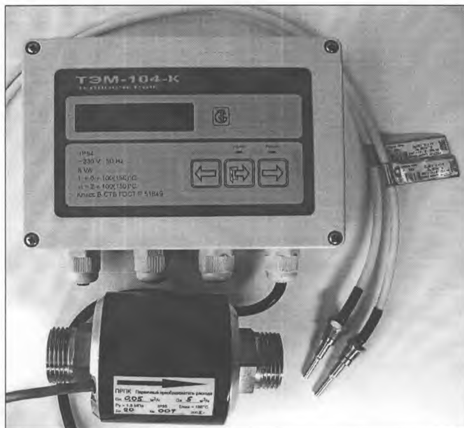
Рисунок 2. Внешний вид теплосчетчика упрощенного («компактного») исполнения ТЭМ-104-К

Схема пломбировки теплосчетчика для защиты от несанкционированного доступа с указанием мест для нанесения оттиска клейма со знаком поверки и знака поверки в виде клейма-наклейки приведена в Приложении Б к описанию типа.