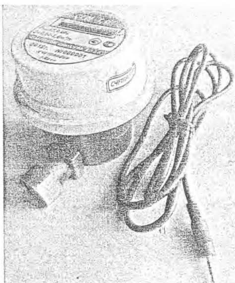
Рисунок 1 – Общий вид счетчиков