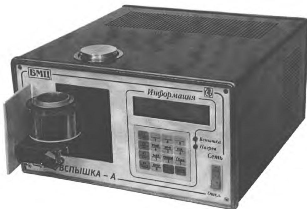
Рис. 1 Внешний вид регистратора автоматического температуры вспышки нефтепродуктов «Вспышка-А»