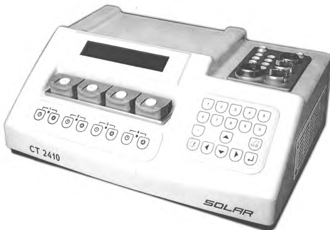
Рисунок 1 – Внешний вид коагулометра