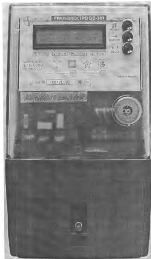
Рисунок 2.1 – Внешний вид счетчиков электрической энергии модификации “Гран-Электро СС-301-Х.Х Х Х Х”