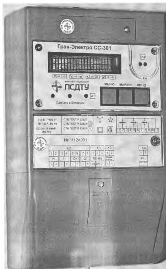
Рисунок 2 – Внешний вид счетчиков электрической энергии модификации “Гран-Электро СС-301-Х.Х Х Х Х (К)”