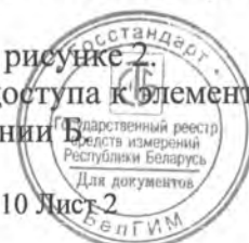
Схема пломбирования счетчиков от несанкционированного доступа к элементам счетчика с указанием места нанесения знака поверки приведена в Приложении Б.

Внешний вид счетчиков «Гран-Электро СС-301» приведен на рисунке 2.