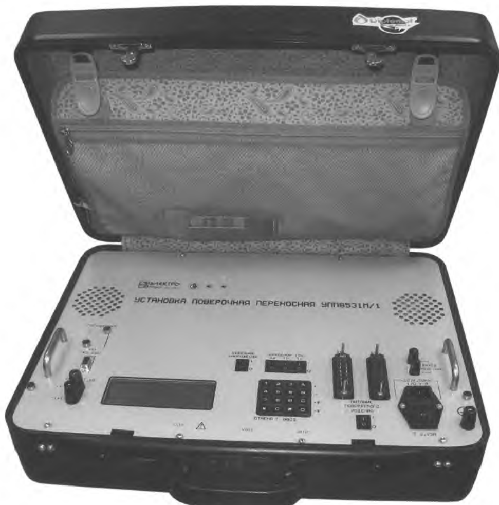
Рисунок 1 – Фотография общего вида УПП