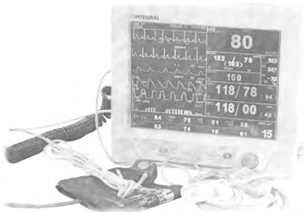
Рисунок 1 – Внешний вид монитора

Схема с указанием места нанесения знака поверки приведена в Приложении к описанию типа. Внешний вид монитора представлен на рисунке 1.