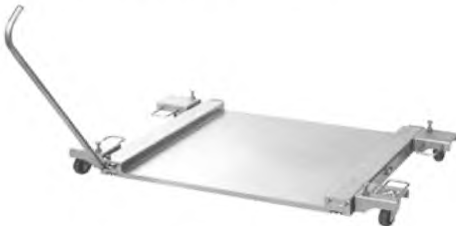
Грузоприемное устройство весов РUA: