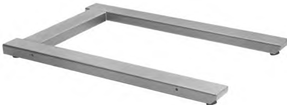
Грузоприемное устройство весов РUA (mobile):