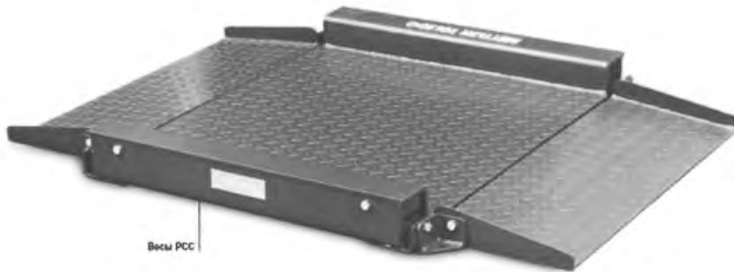
Грузоприемное устройство весов PCS: