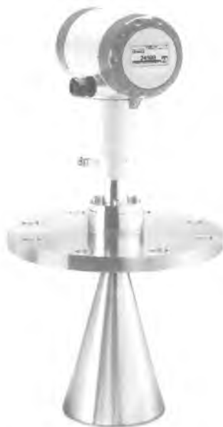
OPTIWAVE 5200 C