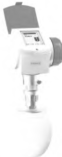
OPTIWAVE 6300 C