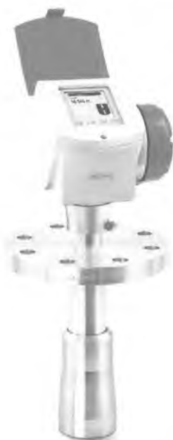
OPTIWAVE 7300 C

Внешний вид уровнемеров представлен на рисунке 1.