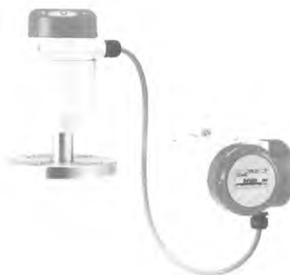
OPTIWAVE 5200 F