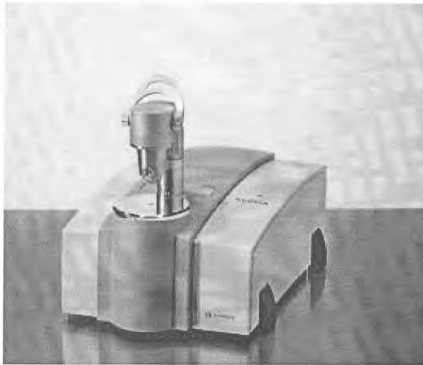
Рисунок 1 – Внешний вид спектрометра