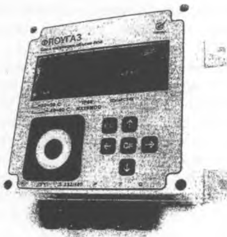
Рисунок 1. Общий вид блока коррекции объема газа «ФЛОУГАЗ».

Вычислитель микропроцессорный представляет собой микроЭВМ, выполненную на базе современной микропроцессорной технологии, позволяющей производить с высокой точностью измерение требуемых параметров, проведение вычислений, а также хранение и вывод информации на внешние устройства.