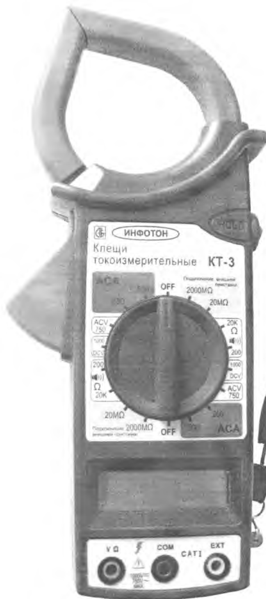
Рисунок 1 – Клещи токоизмерительные КТ-3. Внешний вид

Места нанесения на клещах оттиска поверительного клейма и знака поверки приведены в приложении А.