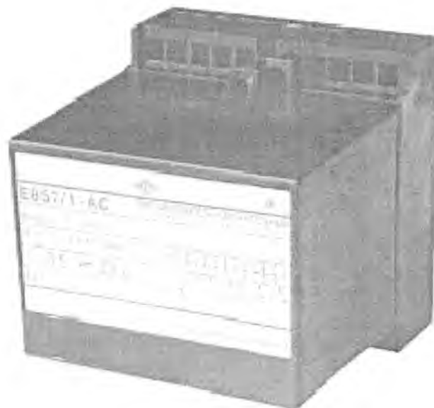
Рисунок 2 – Фотография общего вида